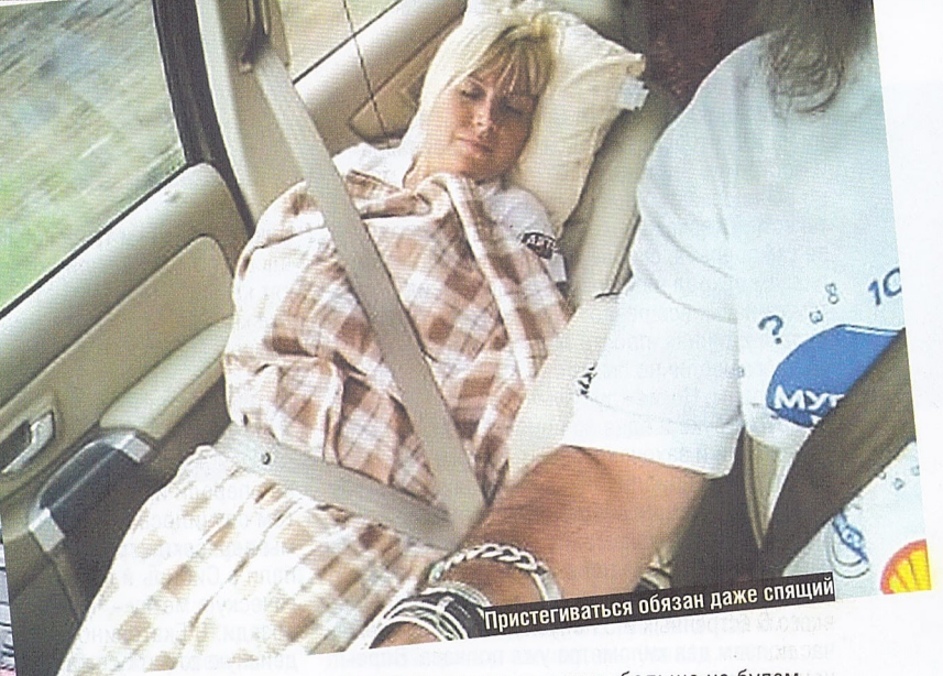
Пристегиваться обязан даже спящий

и наши болельщики смогли в реальном времени отследить перемещения экспедиции, мы буквально за несколько часов до старта установили спутниковый маячок.