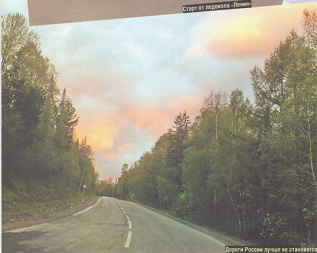
Дороги России лучше не становятся

М ы решили доказать это на практике: сесть в абсолютно стандартную машину в Мурманске, включить отсчет времени и доехать до Магадана за... За сколько, вот в чем вопрос!