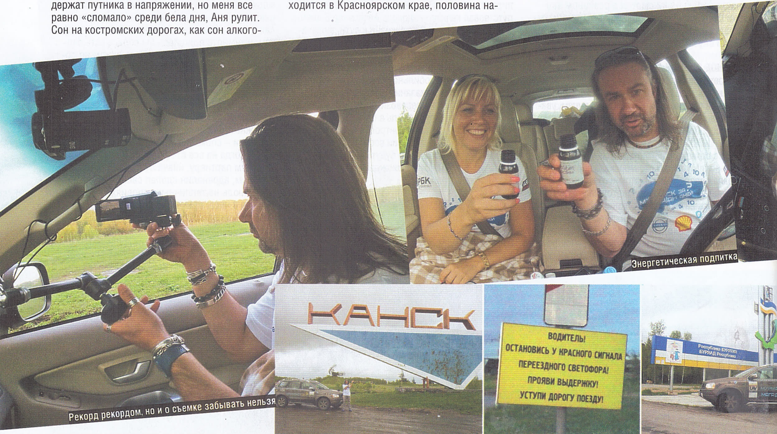
Рекорд рекордом, но и о съемке забывать нельзя

шего географического пути тоже пришлось на Красноярье, на Центральную Сибирь, а теперь мы катимся по Восточной Сибири. Скептики говорили, что в России плохая солярка, но мы-то знаем, что чем дальше от Москвы, тем она лучше. Выбор дизельной машины оправдан – мы получили хорошую автономию, когда дорога позволяла ехать равномерно, заправлялись не чаще чем через 700–750 км. В мотор нашего кроссовера залито масло Shell, каждую третью-четвертую заправку мы контролируем его уровень, но доливка не требуется, зато надо не забыть взять пробу. По просьбе шелловцев мы специальным приспособлением отбираем образцы каждые 4000 км, подписываем время и место на баночках и складываем их в багажник, чтобы европейские исследователи потом изучали по ним нашу географию.