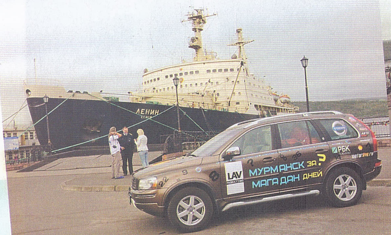
Старт от ледокола «Ленин»

АВТОР: АНДРЕЙ ЛЕОНТЬЕВ