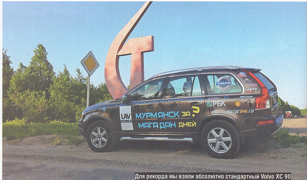
Для рекорда мы взяли абсолютно стандартный Volvo XC 90