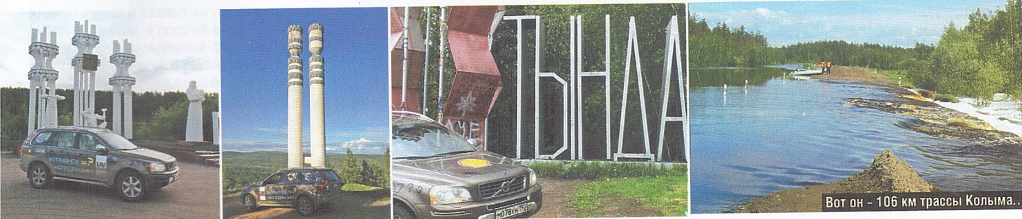
Вот он – 106 км трассы Колыма...