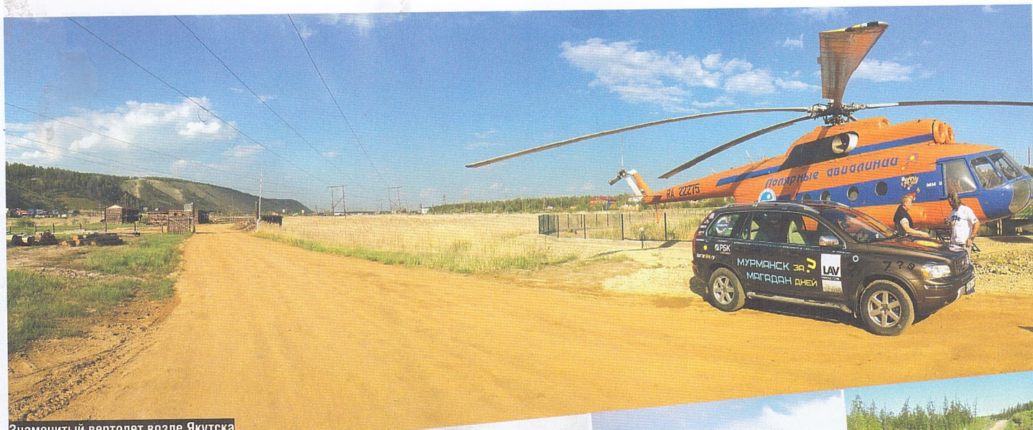
Знаменитый вертолет возле Якутска